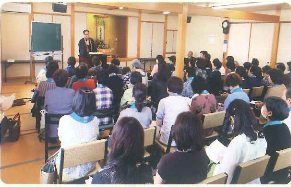
▶総会ご法話の様子