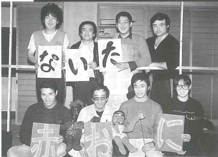
(左) 第1回 『泣いた赤おに』 仏青スタッフ (1984年)

第 3 号 浄土真宗本願寺派 円光寺 〒870-0108 大分市三佐3-15-18 TEL.097-527-6916 FAX.097-527-6949