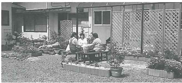
お花の中でお茶しませんか

たくさのきれいな花、そして法の華が咲いています。どうぞお花見に来てください。(坊守)