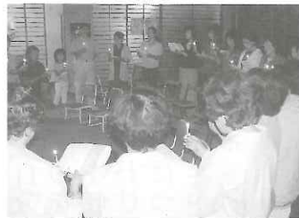
最後は大きな輪をつくってキャンドルサービス “今日の日はさようなら” (7月7日)