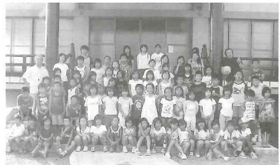
小学生66名、中学生リーダー4名が参加しました(7月26日~27日)