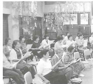
七夕飾りの本堂で、懐かしい童謡や唱歌と一緒に歌いました