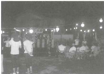
1998年8月1日に始めて10年。新調したやぐらを囲んで鶴崎踊りを楽しみました(8月12日)