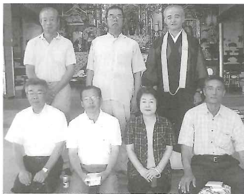
第3回還暦を祝う会(8月15日) これをご縁にお寺にお参りください

お家のお仏壇におまいりしましょう。お仏壇は、阿弥陀さまのお浄土のすがたをあらわします。ご先祖の方々も、そしてこの私も、救うてくださる、南無阿弥陀仏のお徳(おはたらき)が示されています。 そのおいわれを聞かせていただくことを、お聴聞といえます。お家のご法事やお寺の法要行事のご縁に遇わせていただきます。浄土真宗のみ教えにふれていただきたいと思えます。 こうした仏さまのご縁を重ねる中で、「私は浄土真宗の門徒です」と自らの名をつてほしいと思えます。