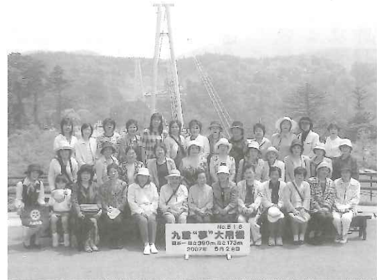
“夢”大吊橋をバックに記念撮影