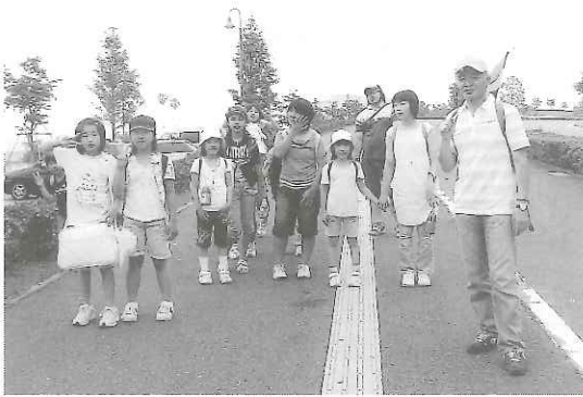
仏旗を先頭に約4kmの道のりをみんなで歩き通しました(6月17日)