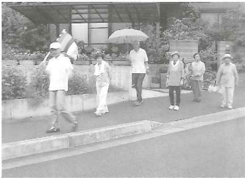
夏至の日・早朝ウォーキング (6月22日) この後、お朝事にお参りました

私たちの生活についても同じようなことがいえると思います。私たちは何か困った、行き詰